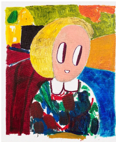
André Butzer. Sin título (Fränzi) (2022).

Sin título (2008) y Tom und Jerry [Tom y Jerry] (2009) son un claro ejemplo de sus lienzos que muestran circuitos de bandas y cables abstractos sobre fondos monocromos, mientras que en 1 Eis, bitte! [¡1 helado, por favor!] (1999) o Aladin und die Wunderlampe los distintos elementos se superponen en diversos planos hasta la saturación.