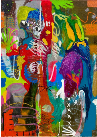
André Butzer. 1 Eis, bitte! [¡1 helado, por favor!] (1999).

Butzer comienza a pintar con 20 años, a mediados de la década de 1990, tras visitar una exposición sobre la colección Guggenheim en la Hamburger Kunsthalle, e inicia sus estudios oficiales primero en la Merz Akademie de Stuttgart y, a continuación, en la Hochschule für bildende Künste de Hamburgo. Pero los abandona pronto para fundar, junto a una veintena de creadores, una academia de arte independiente, la Akademie Isotrop, donde exponen y transmiten sus ideas.