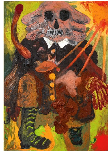
André Butzer. Wanderer [Caminante] (2001). Colección privada

Las obras más tempranas que se muestran son muy oscuras. En Ex-Menschen [Ex-Humanos] (1999) y H-Mensch [H-Humano] (2000) las figuras son sombrías y fantasmales, mientras que en Mörder [Asesino] (1999) introduce el color sobre un fondo pintado por primera vez íntegramente de gris. Con la llegada del nuevo milenio, las siluetas van tomando una forma más definida. Una de ellas es Wanderer [Caminante] (2001), un personaje recurrente en sus lienzos que simboliza la vergüenza de los alemanes por su pasado nazi, con una calavera de mirada inquietante y una mano llena de sangre, bajo un sol radiante cuyos rayos parecen atravesar la figura.